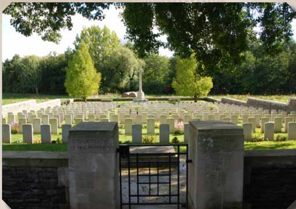
Cimetière Britannique derrière la résidence les Prairies

Transcription intégrale du texte original de l'Abbé Laroche