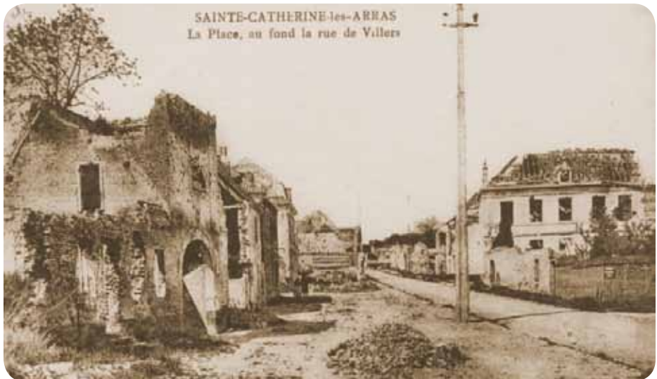
* à droite la Mairie, actuellement la rue Corot

« La rafale passée, nous visitons la paroisse. Rue de Villers sur la côte, route de Lille, les toits sont sans panne, et sans ardoise. Tout est tombé sur la chaussée. La malterie est très abîmée. La sacristie de l'église est aplatie. Le séminaire est méconnaissable. »